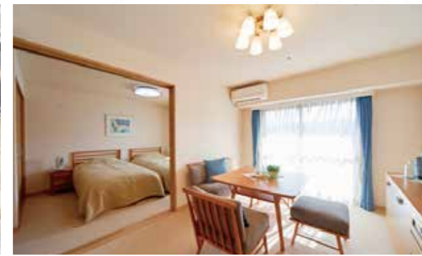
日当たりのいい2間続きの居室。キッチン、浴室、トイレに加え、床暖房も完備。海を望むプランも。他に居室1間のプランもあります