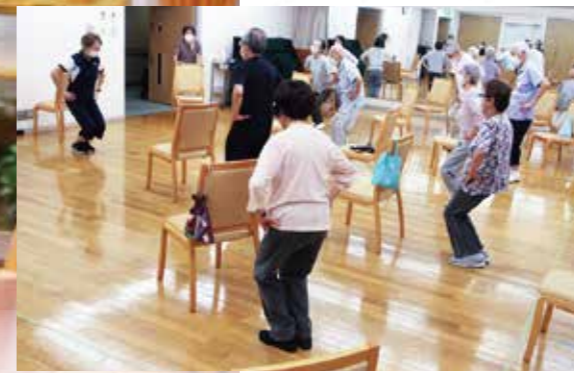
ご入居者に人気の健康エクササイズ。専門のインストラクターが、週4日実施。個人の体力に合わせた複数のプログラムが好評

昨年で開設から25周年を迎えた「ヴィンテージ・ヴィラ横須賀」。高品質な居住空間はもちろん、フロントやフード・サービス、健康管理や介護、日常生活のサポート、アクティビティに至るまで、あらゆるシーンにゆとりあるシニアライフをお届けしています。さらに「介護居室」も加わり、生涯の安心が広がりました。