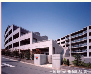
土地建物の権利形態:賃借

■交通:JR横浜線・小田急線「町田」駅より徒歩5分 ■総戸数:116戸 ■開設年月日:平成10年4月1日 ■神奈川県知事指定 特定施設入居者生活介護・介護予防特定施設入居者生活介護・介護保険事業所番号1472601101