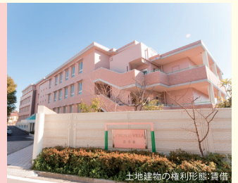
土地建物の権利形態:賃借

■交通:JR根岸線「洋光台」駅より徒歩10分 ■総戸数:102戸 ■開設年月日:平成8年4月1日 ■神奈川県知事指定 特定施設入居者生活介護・介護予防特定施設入居者生活介護・介護保険事業所番号1470700145