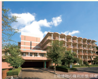
土地建物の権利形態:賃借

■交通:小田急線「登戸」駅よりバス7分「長尾橋」バス停下車、徒歩1分 ■JR南武線「宿河原」駅より徒歩8分 ■総戸数:119戸 ■開設年月日:平成5年12月1日 ■神奈川県知事指定 特定施設入居者生活介護・介護予防特定施設入居者生活介護・介護保険事業所番号1475400246