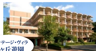
ヴィンテージ・ヴィラ 向ヶ丘遊園

㈱介護施設研究所 代表取締役 首都圏を中心に有料老人ホームの紹介事業を展開。 相談業務歴は15年以上、過去6万件以上の相談に携わる。