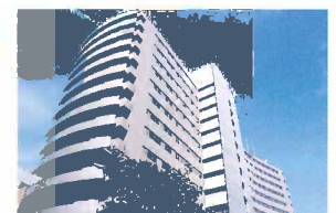
ヴィンテージ・ヴィラ 横須賀 横須賀市西逸見町