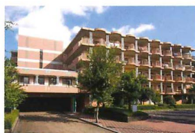
ヴィンテージ・ヴィラ 向ヶ丘遊園 川崎市多摩区