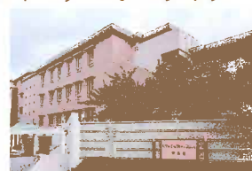
ヴィンテージ・ヴィラ 洋光台 横浜市磯子区