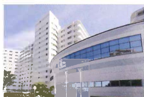
ヴィンテージ・ヴィラ 横浜 横浜市旭区